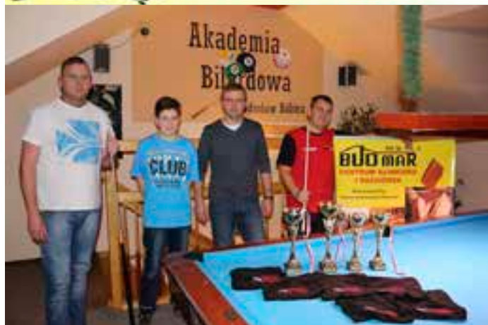
Pierwsza czwórka BUDMAR-CUP IV!