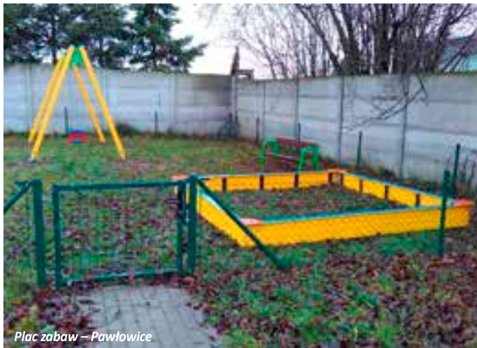
Plac zabaw – Pawłowice

Na przełomie listopada i grudnia br. zakończyła się przebudowa ul. Pawłowickiej w m. Bytkowo. W ramach etapu I, obejmującego budowę drogi wraz z kanalizacją deszczową na odcinku od drogi serwi-