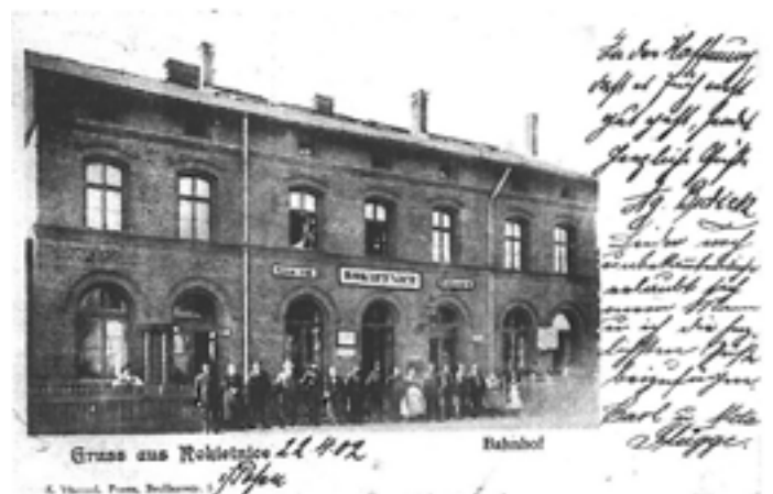
Stacja Rokietnica w 1901 roku.

W 1936 r. według polskiego Urzęduowego Rozkładu Jazdy Pociągów na trasie kursowało 7 par pociągów, w tym 2 pary do Szczecina. Po 1 parze kończyło bieg w: Drawskim Młynie, Wronkach, 2 pary w Szamotułach, a 1 para kursowała tylko do Rokietnicy. W 1939 r., po wybuchu II wojny światowej, cała linia znalazła się w granicach Niemiec. Po 1945 r. Kolej Stargardzko-Poznańska stała się główną linią wyjazdową do i ze Szczecina. Tą trasą do dziś kursuje większość pociągów łączących to miasto z centrum (Poznań, Warszawa, Łódź, Bydgoszcz) i z południem Polski (Wrocław, Katowice, Kraków, Przemysł). W latach 70-tych nastąpiła jej elektryfikacja. Zakończona w 1978 r. trakcja, w swej pierwszej fa-