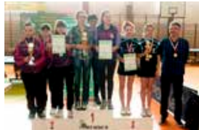
Na drugim stopniu podium kadetki „Słowiana”.