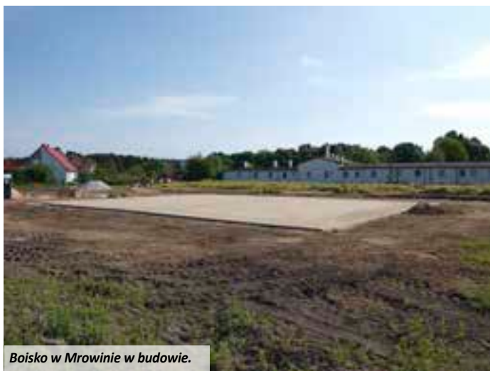
Boisko w Mrowinie w budowie.