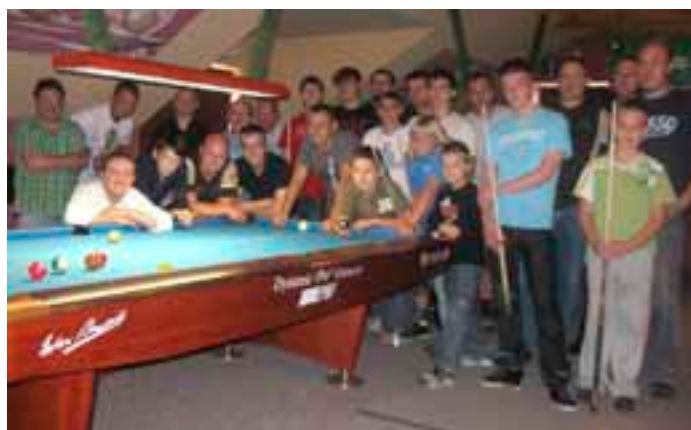
Wszyscy uczestnicy BUDMAR-CUP

wiednich grup zawodowych (FIGHTER, PRO, KILLER) oraz atrakcyjne puchary i nagrody ewidentnie zachęcają do udziału. Pierwszy turniej obfitował w niespodzianki, co jeszcze bardziej