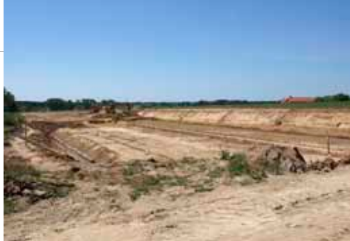
Tu kończy się odcinek IIA

Formalną przyczyną opóźnienia były z całą pewnością kłopoty związane z uzyskaniem decyzji środowiskowej. Realną – problemy finansowe. Jak wielokrotnie informowaliśmy na stro-