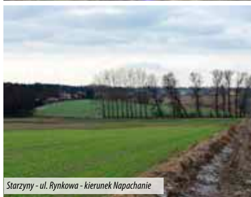
Starzyny - ul. Rynkowa - kierunek Napachanie