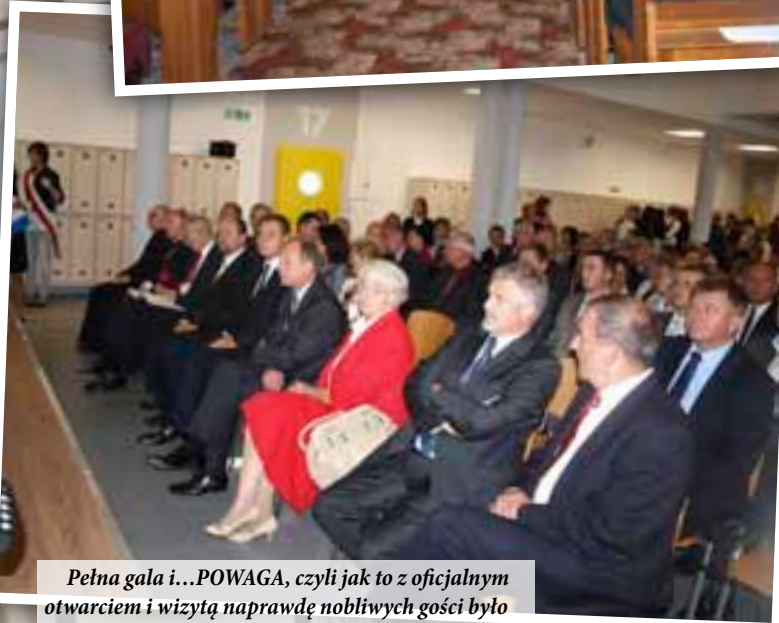
Pełna gala i...POWAGA, czyli jak to z oficjalnym otwarciem i wizytą naprawdę noblistycznych gości było