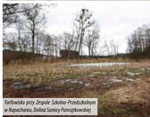
Torfowisko przy Zespole Szkolno-Przedszkolnym w Napachaniu, Dolina Samicy Pamiętkowskiej