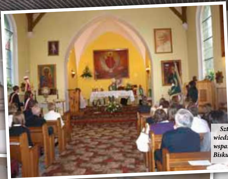
Sztandar, Błogosławieństwo, Odpowiedzialność i ... duszpasterskie słowa wsparcia i modlitwy Jego Eminencji Biskupa Marka Jędraszewskiego