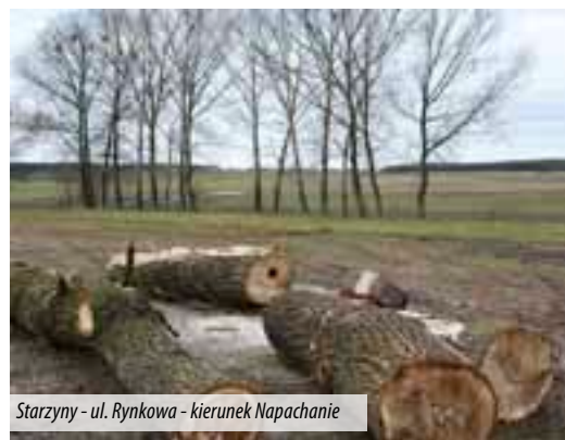
Starzyny - ul. Rynkowa - kierunek Napachanie