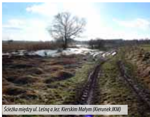
Ścieżka między ul. Leśną a Jez. Kierskim Małym (Kierunek JK.M)

Lokalizacja trasy sportowo-rekreacyjno-edukacyjno-przyrodoznawczej może zainspirować mieszkańców do prowadzenia działań generujących środki finansowe (np. usługi gastronomiczne, sprzedaż rękodzieł regionalnych) wzdłuż tej trasy.