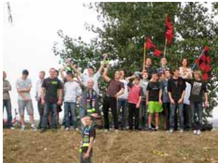
Mecz z Jurandem Koziełtówy - prawdziwe PIEKŁO

Rozpoczął się nowy sezon piłkarskiej A klasy. Wszystko wskazywało na to, że czekają nas kolejne, niczym nie różniące się mecze na rakietyckim „kartoflisku”. Aż tu nagle pojawili się oni – Ultrasi. Według bardzo starego nazwnictwa, w środowisku kibicowskim wyróżnia się: