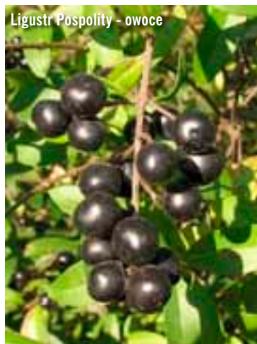
Ligustr Pospolity - owoce

- cis pospolity – roślina pospolita występująca w ogrodach przydomowych, lasach oraz parkach. Owocuje od września do listopada. Charakterystyczne są wówczas czerwone kuleczki osłaniające trujące nasiona. Cała ro-