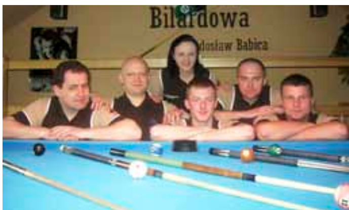
Drużyna Akademii Bilardowej Rokietnica