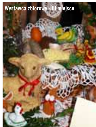
Wystawca zbiorowy - III miejsce