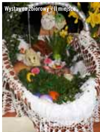
Wystawca zbiorowy - II miejsce