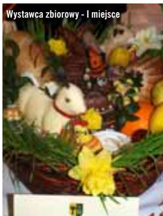
Wystawca zbiorowy - I miejsce

Wracam na podsumowanie konkursu. Przed budynkiem Klubu Sołeckiego Mrowino – Cerekwica stoi wóz transmisyjny TVP. Przedsięwzięcie cieszy się coraz większym zainteresowaniem i renomą, wcześniej słyshałam zapowiedź w Radiu „Merkury” Poznań. Wspaniale. Ponownie wkraczam do wnętrza innego wymiaru. Kapituła, zwiedzający w międzyczasie IX Wystawę Stołów Wielkanocnych, zorganizowaną przez osiem sołectw gościnniej Gminy Rokietnica, przygotowuje