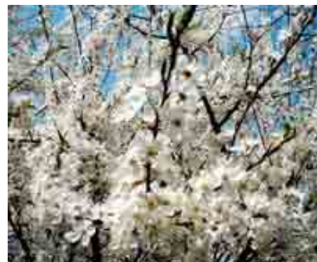
Zuzanna Zachciał – III miejsce „Biały świat”

Wszystkie zdjęcia będą wystawione na korytarzu szkolnym, a w okresie wakacyjnym w Urzędzie Gminy w Rokietnicy.