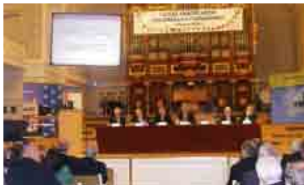
! Zjazd Samorządowców Aglomeracji Poznańskiej