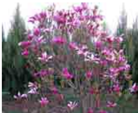
Patrycja Rzepczyńska - III miejsce

ponieważ każda oddana fotografia ukazywała piękno budzącej się do życia po zimie wiosny.