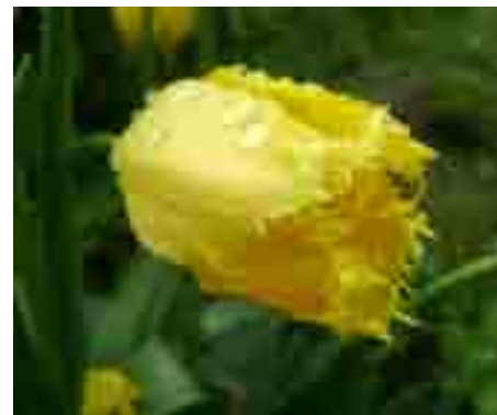
Patrycja Guźlewska – III miejsce „Wiosna w moim ogrodzie”

ponieważ każda oddana fotografia ukazywała piękno budzącej się do życia po zimie wiosny.