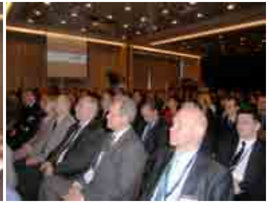
III Forum Gospodarcze Aglomeracji Poznańskiej

Po dotychczasowych dwóch edycjach Forum, podczas których dokonano analizy potencjału aglomeracji i jej szans rozwoju zwłaszcza w kontekście organizacji Euro 2012 oraz stworzono kompleksową ofertę