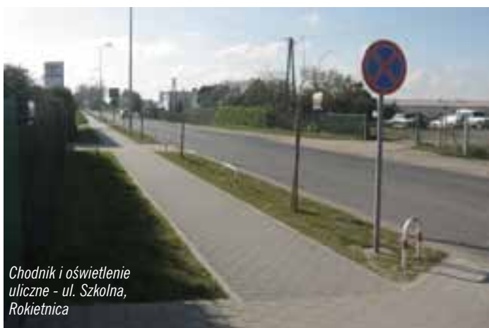
Chodnik i oświetlenie uliczne - ul. Szkolna, Rokietnica