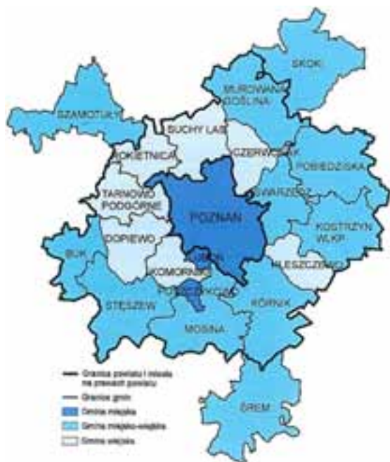
Zmiany liczby ludności (2000-2008) w aglomeracji poznańskiej